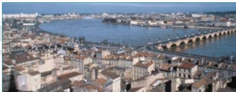
▲ Bordeaux, métropole internationale.

Créée au printemps 2004 par différents partenaires publics et privés, la Société d'Economie Mixte Locale "Route des Lasers", est chargée de réaliser des opérations d'acquisition, d'aménagement ou de construction destinées à accueillir des entreprises liées aux filières optique, laser et plasmas. La première de ces zones d'activités sera aménagée dès 2004 sur 20 hectares à proximité immédiate du Laser Mégajoule. ■